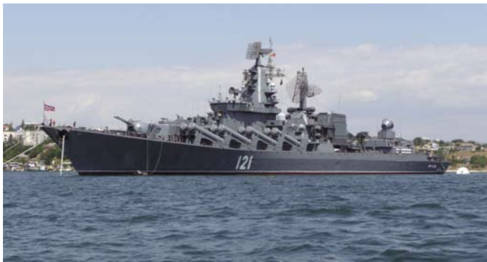
Efter det att Turkiet sköt ned en Su-24 svarade Ryssland med att förflytta robotkryssaren Moskva till kustområdet vid norra Syrien. Kryssaren förfogar över långräckviddiga marina luftvärnsrobotsystem av typ S-300 vilket ger en räckvidd på 90 km och en höjdtäckning upp till 27 000 meter.

För svenskt vidkommande har vi cementerat fast oss i ett försvarsbeslut som ger oss det gamla ”en-veckas-försvaret” men inte skapar möjligheter för att hantera kraftiga svängningar i hotbilden i vårt närområde. Trots en snabb förändring av läget i vår omvärld fokuserar politikerna och massmedia i Sverige helt på flyktingproblematiken, som även den i hög grad påverkas av IS och läget i Syrien.