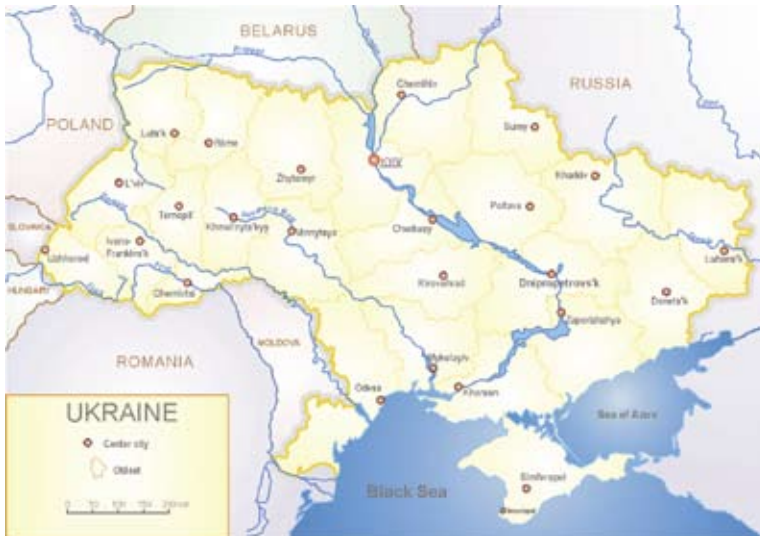
Ukraina med omnejd, karta av Sven Teschke, http://commons.wikimedia.org/wiki/File:Map_of_Ukraine_political_enwiki.png

torsdagen den 4 februari kl 1830-2100 på FHS i Stockholm