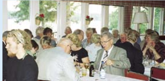
Ät middagen i vår vackra matsal.

Ägare: Luftvärnets Befälsutbildningsförbund