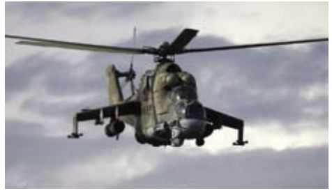
Attackhelikoptrar av typ Mi-24 P används för rena attackinsatser och för att understödja vid räddningsaktioner för nedskjutna piloter (CSAR).

inträffat gentemot den turkiska grannen omedelbart norr om flygbasen i Latakia. Den absolut allvarligaste händelsen var när ett ryskt tungt attackplan av typ Su-24 sköts ned av turkiska F-16 flygplan. Detta skedde efter att flygplanet hade kränkt Turkiets luftrum i 17 sekunder enligt turkiska källor. Nedskjutningen skedde 4 km in i syriskt luftrum enligt amerikanska regeringskällor men påstods ha varit inne på turkiskt luftrum mellan 2-3 sekunder. Utan tvekan har syftet varit att statuera ett exempel. Bara några timmar efter nedskjutningen proklamerade den ryske försvarsministern Schoigu att det modernaste luftvärnsrobot-systemet S-400 har flygtransporterats till området för att öka skyddet för de ryska flygstridskrafterna.