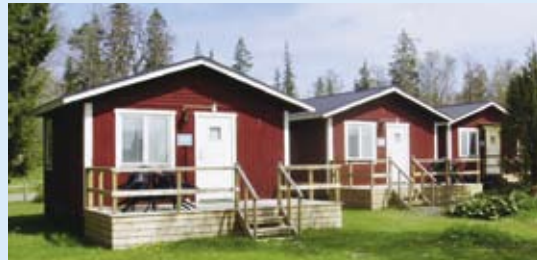
Välj att bo i stuga eller rum.

Min personal och jag satsar på att ta hand om er på allra bästa sätt för att ni skall trivas. Vi hjälper till att ordna t ex.