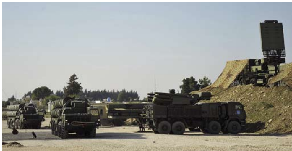
T.v. två S-400 missilfordon, t.h. en Pantsir-S1 (SA-22) med förmåga att bekämpa kryssningsmissiler

Ryssland tog även det diplomatiska initiativet och lyckades mot alla odds att få till stånd förhandlingar om Syrien i Wien. Totalt finns delegater från 20 olika länder representerade vid förhandlingarna. Alla de fem länderna med veto-rätt i FN finns närvarande vid förhandlingsbordet. Det som förvånade mest var att USA även inbjöd ärkefienden Iran till förhandlingarna. Iran med dess kopplingar till al Assadregimen kan bli en viktig aktör i dessa förhandlingar.