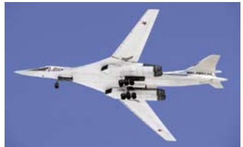
Tu-160 kallas också för den vita svanen. Detta ryska överljudsbombplan sattes in den 17 oktober då Ryssland trappade upp insatserna mot IS i Syrien. Flygplanet fällde kryssningsrobotar över Medelhavet mot mål långt in i Syrien.

USA försökte i informationskriget kritisera den ryska insatsen för att den inledningsvis bombade de USA-stödda rebellgrupperna mer än IS. Men USA hade nackdelen av att ha bombat "Läkare utan gränser" sjukhus i Kunduz (Afghanistan) vid samma tidpunkt av misstag. Detta angrepp kostade 30 människors liv varav 13 var läkare och