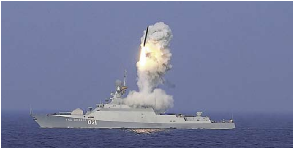
Korvetten Grad Svijazjsk ur den marina styrkan i Kaspiska havet stod för den överraskande attacken med kryssningsrobotar i början på oktober. Kryssningsrobotarna är vertikalstartande. Fartygen är lika långa som våra Visbykorvetter.