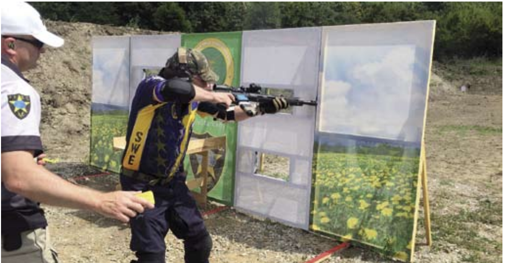
EM i Gevär i Ungern