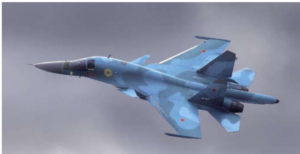
Det nya tunga toppmoderna attackplanet Su-34 som skall på sikt ersätta Su-24 har satts in i striderna i Syrien. Flygplanet tar upp till 8 tons vapenlast med bl.a. precisionsvapen som styrbara bomber och robotar.