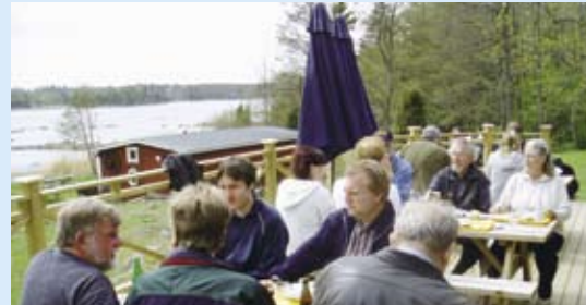
Vår nya stora altan mot havet i anslutning till matsalen.