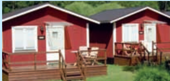
Välj att bo i stuga eller rum.