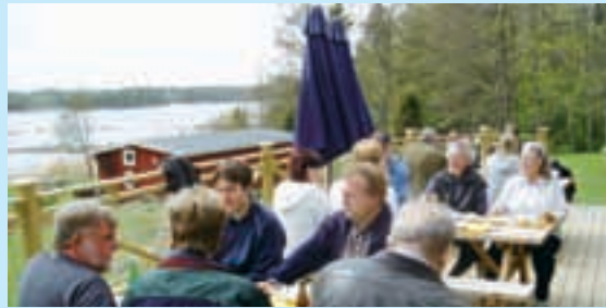
Vår stora altan mot havet i anslutning till matsalen.