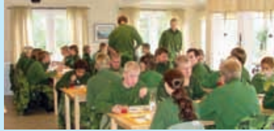
Ät middagen i vår vackra matsal.

Ägare: Luftvärnets Befälsutbildningsförbund