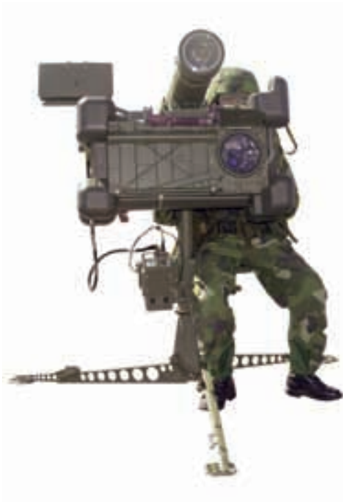
EldE70 med IFF-antenn uppe till vänster på siktet och IFF-elektroniken mitt på stativet.

EldE70 kommer utrustas med IK-utrustning (IFF) från Thales av SBD. Skytten måste lära sig fler ”blinkningar” i siktet eftersom NATO har flera olika ”IFF-svar” än det gamla svenska IK-systemet då det ju bara fanns ett svar ”Eget”, lätt förenklat.