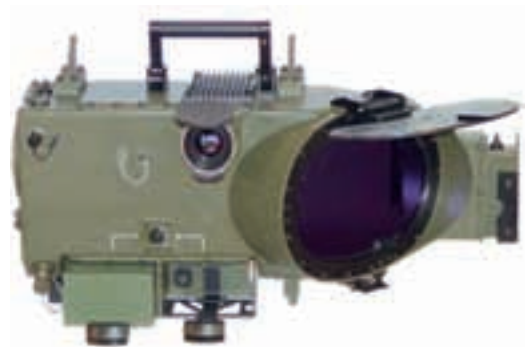
Mörkersikte BORG

Till EldE anskaffas ett antal mörkersikten BORG från Saab Bofors Dynamics, SBD, vilket nu gör att RBS70 får mörkerförmåga vilket var ett krav/önskemål från Luftförsvarsutredning 1967 (LFU67), då det en gång i tiden beslöts att ta fram RBS70. Nu 40-år senare kan vi alltså ”lösa uppgiften”. Detta är dock en sanning med modifikation eftersom det under tiden togs fram ett system som inledningsvis hette RBS70M, och senare blev RBS90, som har mörkerförmåga.