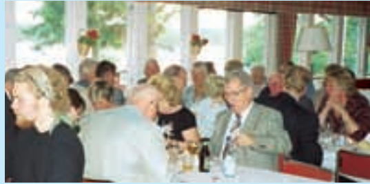
Ät middagen i vår vackra matsal.

Ägare: Luftvärnets Befälsutbildningsförbund