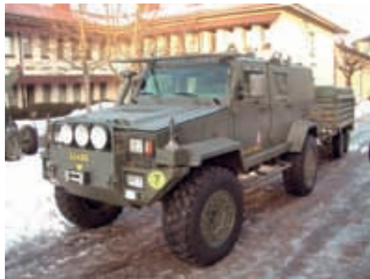
PTGB6 D 4x4 SPS med Bv-kärran kopplad.

Inriktningen är att eldenheterna ska transporteras i det pansrade fordonet PTGB6 D 4x4 SPS ”GALTEN” (PersonTerränGBil 6 passagerare Diesel fyrhjulsdraft SplitterSkyddad som förkortningen står för.)