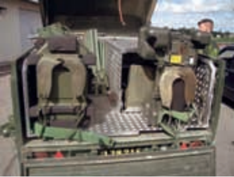
Lastförsök med inredningen.

Släpet är beprövat och har bl. a används inom RBS90. Till släpet har en speciell inredning tagits fram så att materielen transporteras säkert och lättåtkomligt.