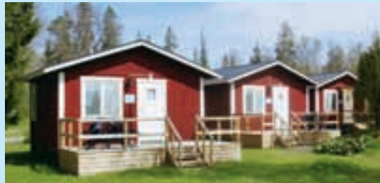
Välj att bo i stuga eller rum.