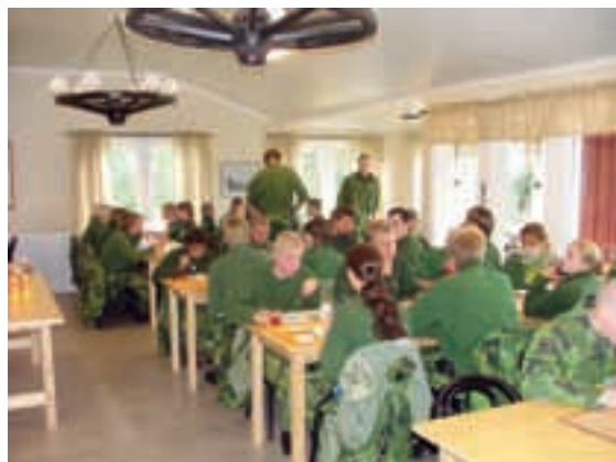
Matsalen Lvbyn okt 2006.