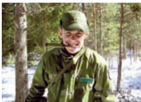
Foton: Simon Ekström