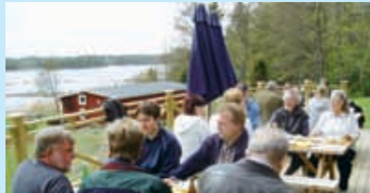
Vår nya stora altan mot havet i anslutning till matsalen.