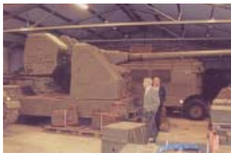
Prototyp av 12 cm fältautomatkanon, pjäsen hade egen spaningsradar och centralinstrumentering, den kunde med sina zonnörprojektiler bekämpa bombflyg på 10 000 m höjd.