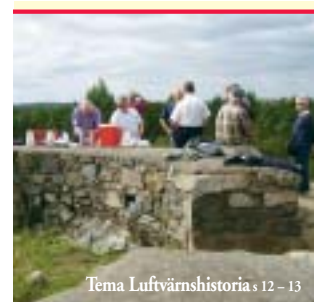
Tema Luftvärnshistoria s 12 – 13

Den nya redaktionen gav tidskriften år 2000 namnet Vårt Luftvärn. Den fick även en helt ny layout. Så här såg Vårt Luftvärn ut efter 6 år med redaktionen Pederby – Werle.