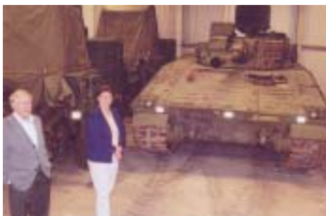
Prototyp av Lvkv 90, vagnen kunde med radar upptäcka helikoptrar bakom trädriddäer och stå i bakhåll med sikte, laser och eldrör inriktade för sekunds snabb bekämpning.