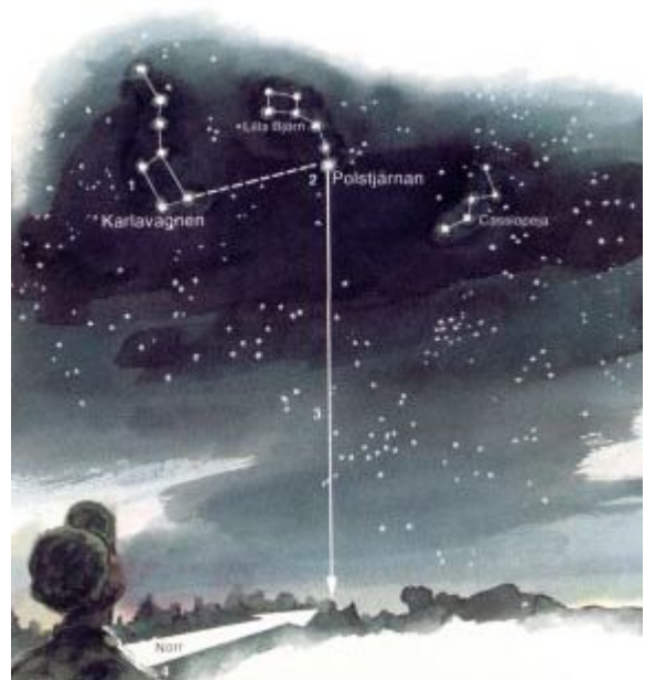
Karlavagnens "bakkant" pekar mot Polstjärnan, vilken står rakt över nordpolen = i norr.