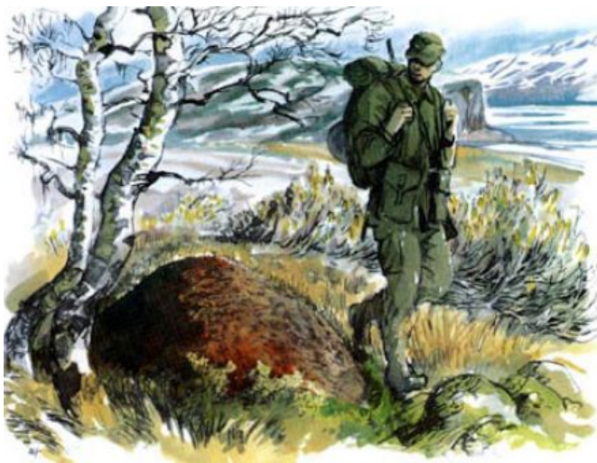
Myrstackar ligger ofta på sydsidan av träd eller stenar.